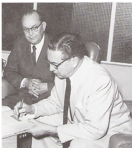
Assinatura da compra da primeira sede do Sindimetal...

Mas o sonho de transformar a associação profissional em sindicato só se concretizaria muitos anos depois, quando seria expedida a carta sindical da entidade, em novembro de 1959.